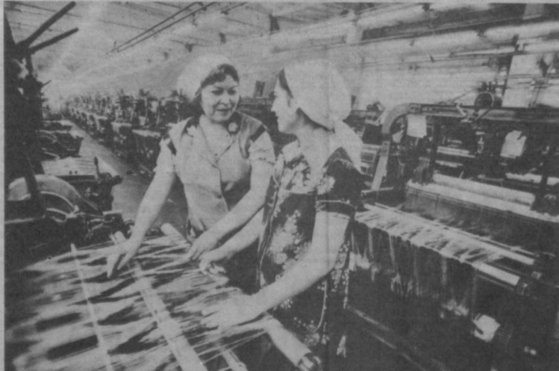
Забота о качестве — это забота о росте квалификации молодой смены. Это — твердая установка в коллективе маргиланского производственного объединения «Атлас».