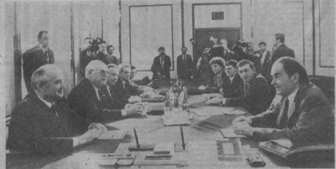
Во время встречи.