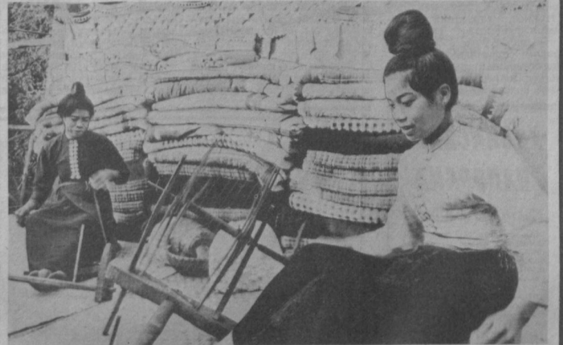
СРВ. Шагом через эпоху явилось развитие вьетнамской провинции Шонла за годы после установления в стране народной власти. В колониальный период мек, тхай, кхму и другие малые народности, населяющие этот горный край, жили за счет подсечно-огневого земледелия, охоты и собирательства. Были полностью неграмотны. Эпидемии уносили жизни тысяч людей. Сегодня все дети представителей национальностей ходят в школы, создана широкая сеть медицинских учреждений, построены клубы, открыты библиотеки, растет индустриальный уровень жизни населения объединено в кооперативы, и на всю страну известен агропромышленный комплекс Монкту с его молочными фермами, чайными плантациями и перерабатывающим предприятием. НА СНИМКЕ: в одном из кооперативов в провинции Шонла.

ХОШИМИН, 11 мая. Более 90 тысяч тонн первой вьетнамской нефти, добытой интернациональным коллективом совместного вьетнамско-советского предприятия «Вьетсовет», уже продано иностранным заказчикам, пишет газета «Сайгон зэй фонг». Нефтегазодобычающая промышленность — новая отрасль народного хозяйства СРВ — создавалась и развивалась при содействии Советского Союза. Образованное в ноябре 1981 года совместное вьетнамско-советское предприятие превратило южновьетнамский город-курорт Вунгтау в промышленный центр республики. Мощная советская техника позволила найти большие запасы нефти и газа. В этом году, отмечает газета, будет добыто не менее 270 тысяч тонн нефти, а к концу десятилетия Вьетнам сможет полностью обеспечить себя нефтепродуктами. (ТАСС).