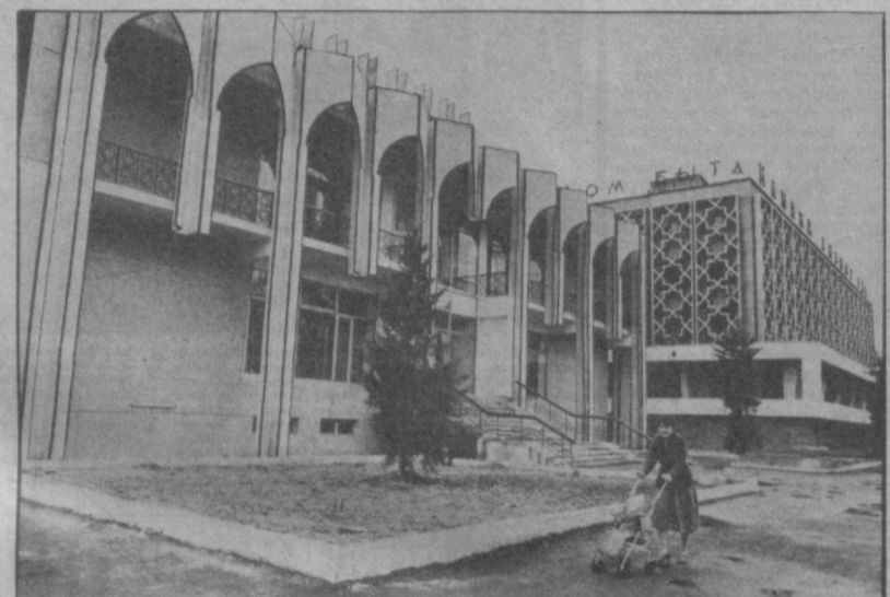
Недавно в Анджане выросло здание нового комплекса бытового обслуживания площадью около двух тысяч квадратных метров. Жителям города здесь будет оказываться более широкая видов услуг.

Обделены любители кино. Но и работникам кинопроката нелегко. Как совместить вы-