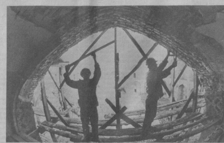
Богата памятниками зодчества древняя Бухара. Сейчас здесь ведутся реставрационные работы в архитектурном ансамбле конца XVI века — медресе Мадрихан и Абдуллахан. Их осуществляют мастера Бухарской специализированной научно-реставрационной производственной мастерской имени Усто Ширина Мурадова.

По итогам социалистического соревнования 1986 года среди средних специальных учебных заведений в системе Минвуза СССР Бухарский планово-экономический техникум занял 2-е место.