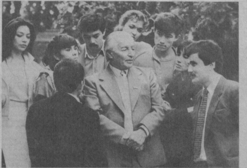
Народному артисту СССР Малику Каюмову — 75 лет. 55 лет — кинематографу в руках. За это время создано 250 документальных фильмов, 26 из них полнометражные. За киноленту «Арганистан. Революция продолжается» М. Каюмов с группой создателей был удостоен Государственной премии СССР за 1981 год. Четверть века он — бессменный художественный руководитель студии документальных фильмов. Почти все работы — его ученики и продолжатели. НА СНИМКЕ: М. Каюмов во время встречи со студентами ВГИКа.