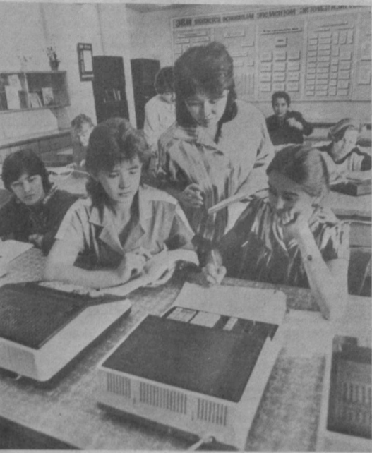
Выпускники техникума трудятся по многим областям республики, в Каракалпакии, в Туркменской ССР.