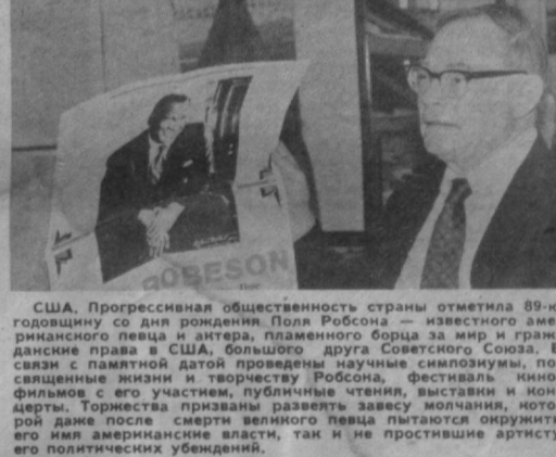
США. Прогрессивная общественность страны отметила 89-ю годовщину со дня рождения Поля Робсона — известного американского певца и актера, пламенного борца за мир и гражданские права в США, большого друга Советского Союза. В связи с памятной датой проведены научные симпозиумы, международные выставки и творчество Робсона, фестиваль кинофильмов с его участием, публичные чтения, выставки и концерты. Торжества призваны развить завету молчания, который даже после смерти великого певца пытаются окружить его имя американские власти, так и не простившие артисту его политических убеждений.