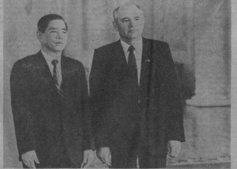
НА СНИМКЕ: во время церемонии проводов в Георгиевском зале Большого Кремлевского дворца.

Заседание Совета Старейшин Верховного Совета Узбекской ССР состоится сегодня, 22 мая, в 9 часов в зале заседаний ЦК Компартии Узбекистана.