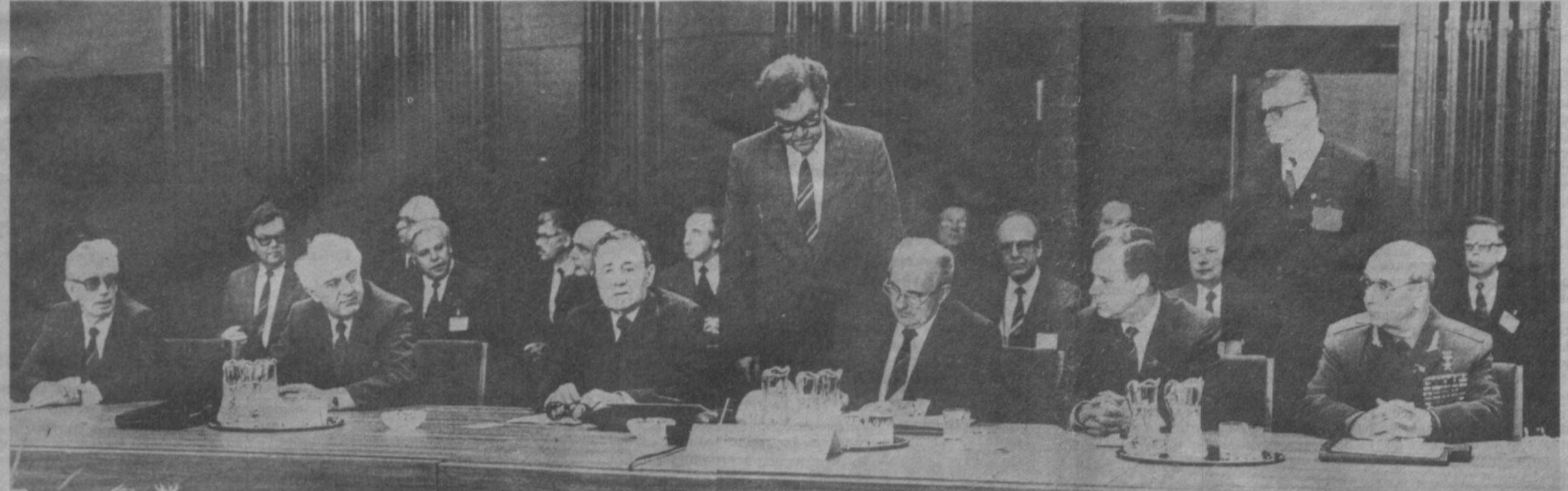
Глава советской делегации Генеральный секретарь ЦК КПСС М. С. Горбачев подписывает документ «О военной доктрине государств — участников Варшавского Договора».