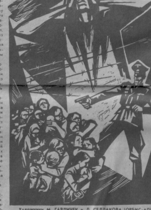
Художники М. ГАВЛИЧЕК и Д. СЕДЛАКОВ (ОРБИС-АПН).