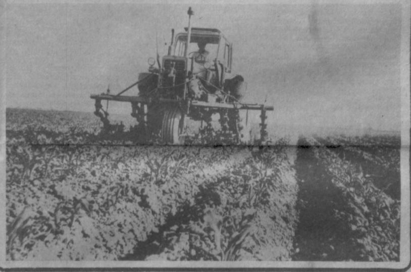
Идет обработка междурядий кукурузы в совхозе имени Х. Алмаджана.