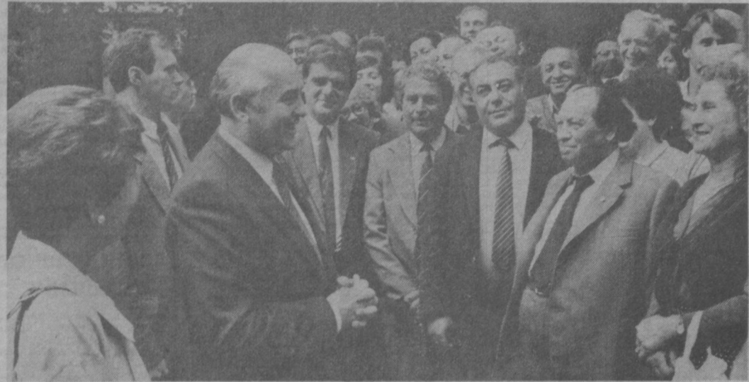
Во время беседы М. С. Горбачева на избирательном участке.

Затем М. С. Горбачев ответил на вопросы советских и иностранных журналистов.