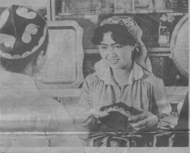
Сотны по счету и самым крупным в Задарвинском районе Наманганской области стал открывшийся в поселке Джумауйя центральный универмаг. Его торговая площадь более 700 квадратных метров. Здесь разнообразный ассортимент промышленных и продовольственных товаров, которые можно также