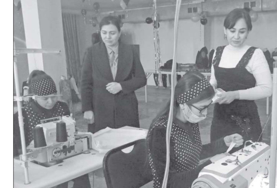
Дар авули Абайи ноҳияи Берунии Ҷумҳурии Қарақалпоқистон сеҳи дўзандагӣи ҶММ «Беруний текстилинвест» фаёлияти худро ба роҳ монд. Қорқона 50 нафар ҷавон ва занони ба рӯйҳати «Дафтари ҷавонон» ва «Дафтари занон» гирифташудаи худудро бо қор таъмин мекунад.

Қайд гардид, дар соли 2020 ҳаҷми содирот 15,1 миллиард доллари ИМА-ро ташкил намуд. Маҳсулоти наздик 2,7 миллион адад қорқонаҳо ба хориҷ бароварда ва онҳо дар 40 бозори нави беруни харидор пайдо карданд. 210 намуд маҳсулот содир ва ба андозаи 9,8 миллиард доллар сармои хориҷӣ ҷалб гардид, 378,1 ҳазор адад ҷойҳои нави қорӣ ташкил карда шуданд.