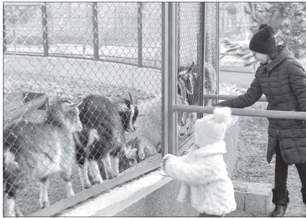
Алҳол дар вилоти Фарғона чандин боғи истироҳат ва масканҳои дилхушӣ мавҷуд мебошанд. Махсусан, дар беш аз 3 гектар майдони шаҳри Фарғона боғи ҳайвонот ҷойгир гаштааст, ки дар он зиёда аз 70 намуди 700 сар ҳайвон ва паррандагонӣ аз кишварҳои гуногун овардашуда парвариш меёбанд. Барои ин ҷондорҳо дар боғ шароити табиӣ табиӣ онҳо фароҳам оварда шудааст. Ин ҷо паланги Амур, хирси малла, лама, пони, шери Африқо, гурги Канада, кенгуру, ҳуки баҳрӣ, ки камёфт мебошанд, нигоҳ дошта мешаванд. Шӯбаи нигоҳубини ҳайвоноти кӯҳӣ масоҳати калонро дар бар гирифтаанд. Скелети паррандаҳои гуногун, динозавр, ки ин ҷо гузошта шудааст, ба таширфорандагон таассуроти калон мегузорад.

Дар сурат: дар боғи ҳайвоноти шаҳри Фарғона.