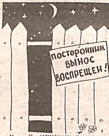
Рис. Г. БЕЗБОРДОВА.