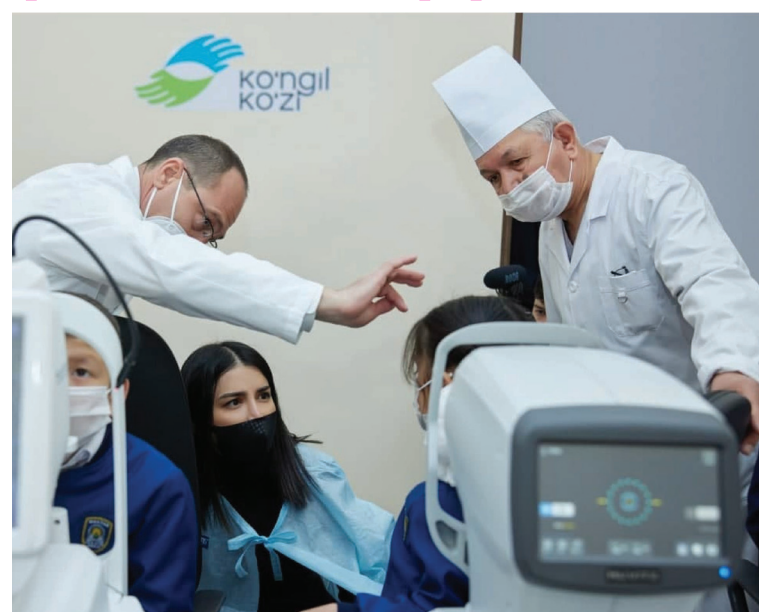
Жами 478 нафар бола учун 630 та операция ўтказилади.

Бундан келиб чиққан ҳолда, болаларнинг баъзилари вилоят касалхоналарида, баъзилари Тошкентда операция қилинади, айримлари эса хориждан жалб этилган мутахассислар ёрдамида даволанади.