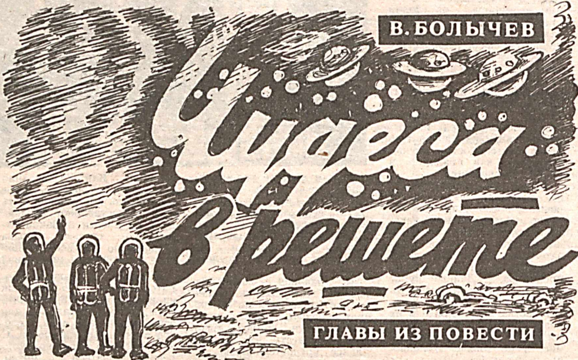
ГЛАВЫ ИЗ ПОВЕСТИ

Вот я и хочу занять их делом. Руководство, в принципе, не против. В свободное от дежурств время будем репетировать. Кое-кого из ребят уже присмотрел,