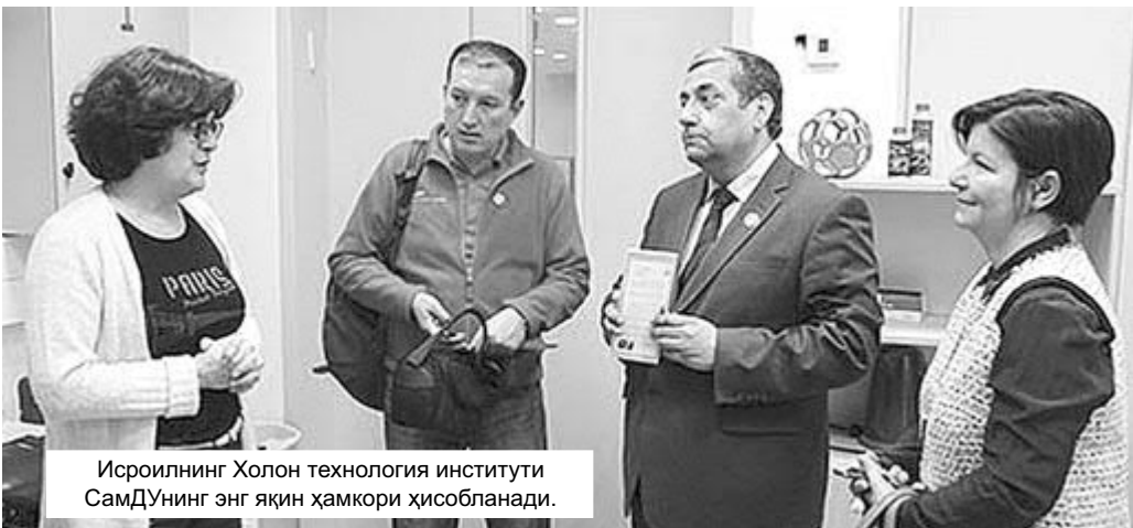
Исроилнинг Холон технология институти СамДУнинг энг яқин ҳамкори ҳисобланади.