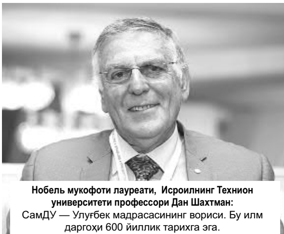
Нобель мукофоти лауреати, Исроилнинг Технион университети профессори Дан Шахмат: СамДУ — Улуғбек мадрасининг вориси. Бу илм даргоҳи 600 йиллик тарихга эга.

Бугун XXI асрда инсоният илм-фан тараққиётида мисли кўрилмаган юксалишларга эришди. Ҳақиқат шундаки, бекиёс имкониятлар замирида ўта ривожланган илм-фан мужассамлашган. Дунёни бугун куч-қудратлилар эмас, кучли тафаккур ва билим эгалари бошқармоқда. Ҳаёт даражаси ҳам аслида илм-маърифатнинг ҳақиқий аҳолига боглиқ. Бугун Миллат билиши ва англаши зарур бўлган рост гап шуки, фақат илм бизга нажот бера олади. Фақат илм бизни миллат ва давлат сифатида асраб қолади. Мустақил миллат, мустақил мамлакат бўлиб, ер юзиде мустақам ва муқим туришимиз учун ҳам илм-фан жаҳон талабларига, даражаларига яқинлашиши керак. Бу халқимиз учун сув ва ҳаводай зарур. Дунёда бугун таъбир жоиз бўлса, аллақачон илм-фан жанги бошланган. Тасаввур қилинг, бу беллашувда ким ғалаба қозонади? Ким ғолиб бўлади? Билимилар ғолиб бўлади. Илмилар ғалаба қозонади. Мана, илм бизга нима учун керак.