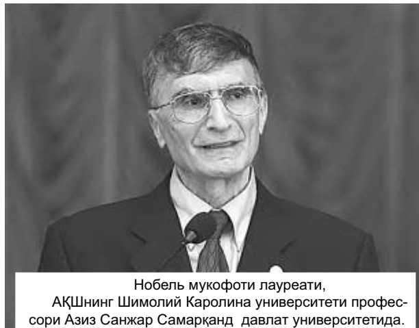
Нобель мукофоти лауреати, АҚШнинг Шимолӣ Каролина университети профессори Азиз Санжар Самарқанд давлат университетиди.