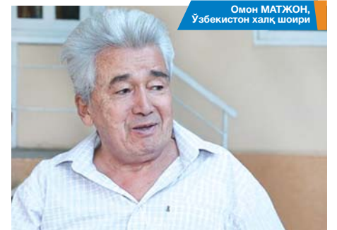
Омон МАТЖОН, Ўзбекистон халқ шоири

У куйлайди тупроғингни сенинг, о ўлка, Унинг ёлғиз ҳамроҳидир қувгин ва алам. Кета туриб олган сиқим тупроғи ичра Бор эди қон ва бор эди бир кичик қалам. Шундай кетди ул саркарда юртдан бешуҳрат, Фақат қалам ола кетди ва қалбдан нидо. Олисларда топса ҳамки ганжи беадад, Она Ватан кўйида у бўлди бир гадо.