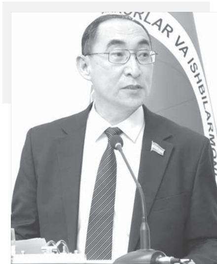
Тўлқинжон КАРИМОВ, Олий Мажлис Қонунчилик палатаси депутати, О'zLiDeP фракцияси аъзоси:

кенгашлар, жумладан, партияларга ҳам катта масъулият юклайди. Бу борада амалга оширилаётган ислохотларга партияимизнинг фаоллигини ошириш, депутатларнинг аҳоли билан ишлаш тизимини тубдан ўзгартириш, жойларда йиғилиб қолган муаммоларни ўз вақтида ҳал этишда уларнинг назоратини кучайтириш ғоят муҳимдир.