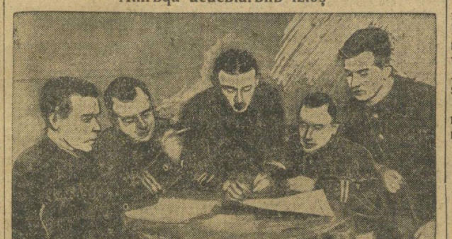
Amryga usucylarbn izlsh