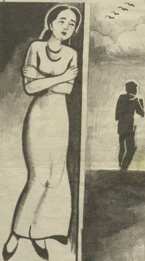
сан менадан", деб ҳазил қиларди.