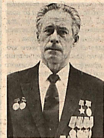
К его боевым орденам и медалям добавился орден «Знак Почета».

— К сожалению, — говорит Голубенко, — долгое время деятельность прокурора имела, в основном, обвинительный характер. Но со временем мы стали заниматься своим «родным» делом — жестко контролировать ход следствия, вносить протесты на неправильные решения, добиваться исправления допущенных ошибок. От прокурора во многом зависит соблюдение законности руководителями всех степеней, взятие под стражу или освобождение. Прокурор может решить, возбуждать уголовное дело или прекратить за недостаточностью улик, из-за малозначительности правонарушения.