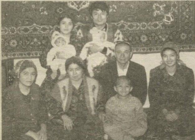
Кўқон шаҳридаги 10-ўрта мактаб ўқитувчиси, Ўзбекистон Қаҳрамони Манзураҳон МАЪМАДАЛИЕВА билан суҳбат.

- Манзураҳон опа, Сиз юртбошимизнинг эъзози билан қаҳрамонлик Олтин юлдузига сазовор бўлгансиз. Бу бахтми ё масъулиятми?