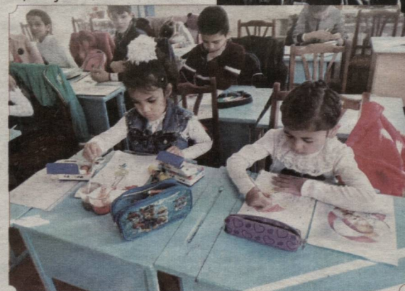
O'quvchilarim uzoq-yaqindan har bir mashg'ulotimizga katta qiziqish va ishtiyoq bilan kelishadi.