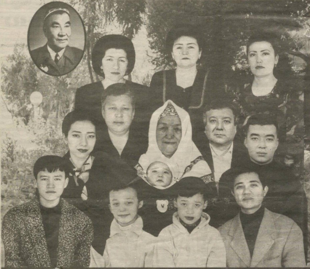
С. АТДА: АЪЗАМХЎЖАЕВЛАР ОНЛАСИ

Қаранг-а, келин ойи, шунча йил муҳаббат қилиб, сиз ҳақингизда энди эзаяпман-а. Узр! Ҳаётни, одамларни кўриб, ўзим ҳам келинойи, қайнона ва буви бўлгач, Сиз ҳақингизда кўпроқ ўйлай ҳақландим-да!