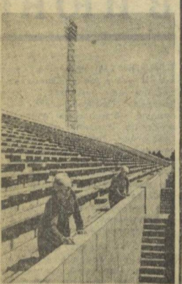
В колхозе «Политотдел» Верхнеиринского района заканчивается строительство стадиона на 12 тысяч мест.