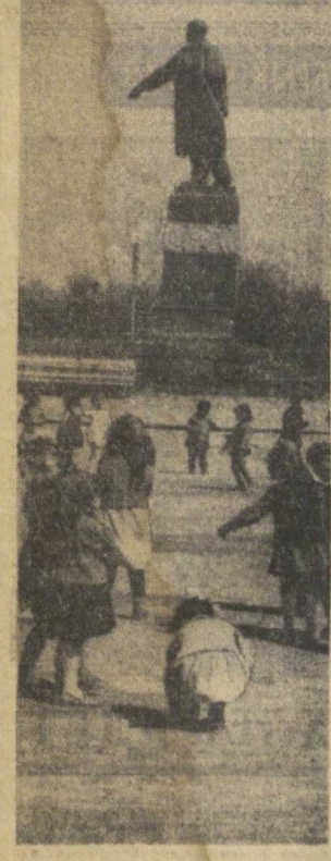
По городам республики. На центральной площади столицы Караналпайи — Нукуса.

МНОГОЭТАЖНЫЕ здания из бетона и стекла, широкие улицы и площади, тенистые парки и скверы, фонтаны и водная гладь бассейнов... Красивый солнечный город, город завтрашнего дня — такой предстала столица нашей республики перед участниками очередного пленума городского комитета партии, посетившими выставку «Ташкент 1980 года». Все, что увидели на выставке партийные активисты, явилось яркой иллюстрацией того грандиозного плана реконструкции столицы, о котором рассказывал в своем докладе первый секретарь Ташкентского горкома партии С. Р. Расулов. Недавно ЦК Компартии Узбекистана и Совет Министров Узбекской ССР в соответствии с постановлением союзного правительства определили главное направление планомерной и комплексной застройки города. Красота архитектурных ансамблей, максимум удобств для населения, высокое качество и прочность сооружений, использование достижений современного градостроительства и лучших традиций национального зодчества — таковы основные принципы генерального плана развития Ташкента.