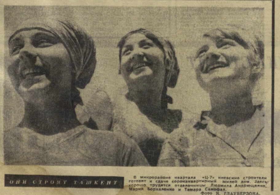
Они строят Ташкент