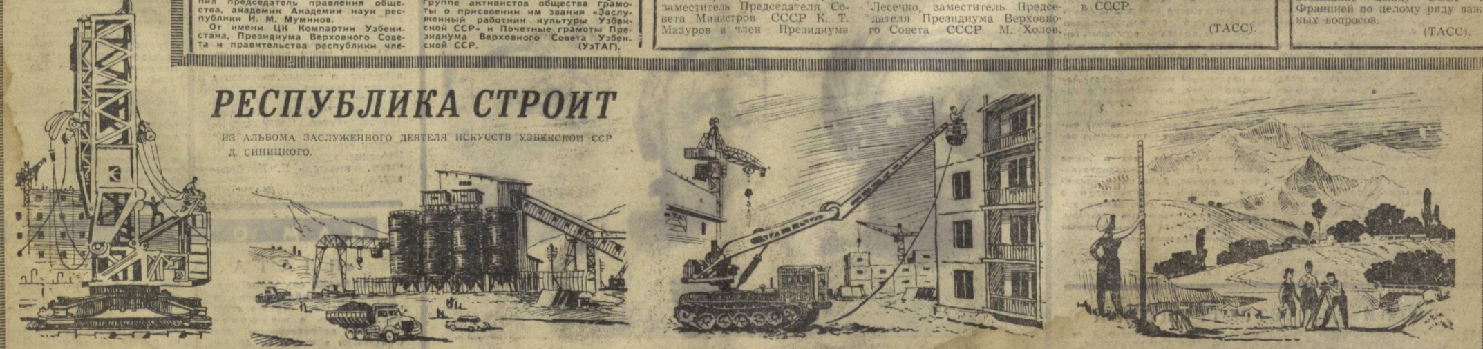
Здесь приступают и строительству дома. Механизаторы монтируют кран.