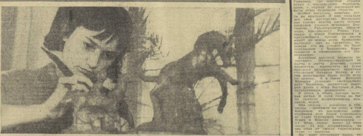
Высоко над головой поднимались мальчишка радужный круг. «Пусть всегда будет солнце» — так названа скульптура, которая в недалеком будущем встанет перед центральным зданием Ташкентского Дворца пионеров имени В. И. Ленина. Выполнена она кружковцами — мальчишками и девчонками, только начинающими свой путь в большое искусство.