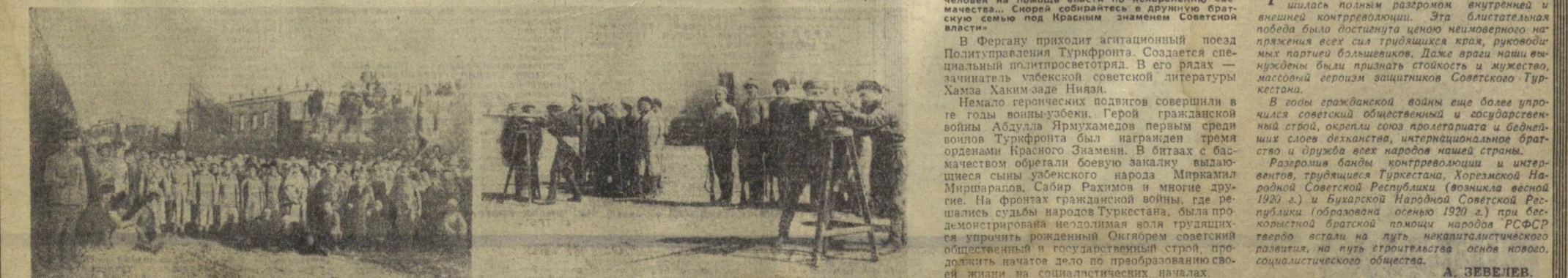
22 мая 1918 года отправлялся из Ташкента красногвардейский отряд на Оренбургский фронт. На снимке слева: отряд перед погрузкой в эшелон, 1919 год. Ленинский учебный пункт в Ташкенте (снимок справа). Идут строевые занятия.