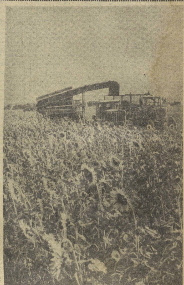
На полях Димжанского совхоза № 76 начался укос подсолнуха, под которым занято 390 гектаров. На полях работают четыре силосоуборочных комбайна.