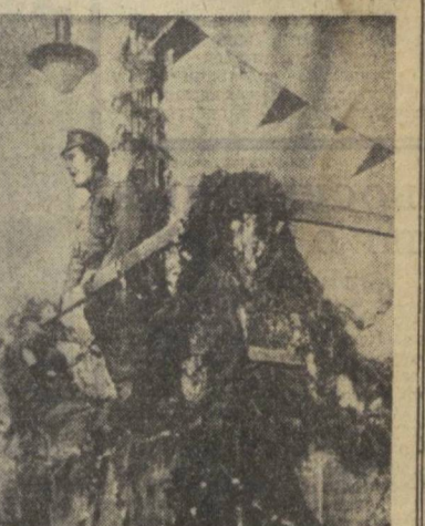
В. В. Куйбышев на трибуне, Ташкент, 1920 год.

Ферганское басмачество в основном было разгромлено. Однако военно-политическое положение Туркестанской области было считать