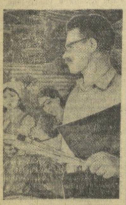
Самаркандские художники и живописцы активно готовятся к республиканской художественной выставке...