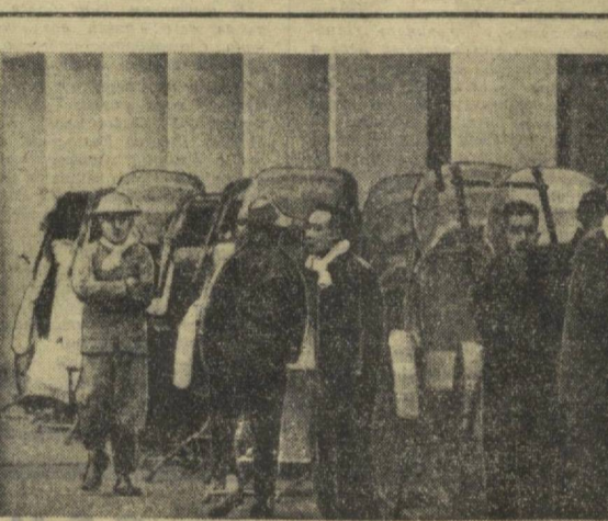
Гонконг. Далекий город трудной судьбы. Город, привыкший к роскоши и нищете, и смешению ширинных европейских обрисов и грязных трущоб азиатских улочек, на которых не разминуться и двум человекам. Житие Гонконга непосредственно связано с улицей. На панелях делают свой «бизнес» продавцы газет и чистильщики сапог, торговцы фруктами и мелкие ремесленники. Улица — единственное средство заработка на низкие старьевщики, метельщики, рикши. На снимке: рикши в ондандан работ.

ВАШИНГТОН, 14 июля. (ТАСС). Вашингтон продолжает эскалацию войны во Вьетнаме. Президент США Джонсон и генерал Уэстморленд заявили вчера после встречи в Белом доме, что они договорились о посылке дополнительных войск в Южный Вьетнам. Однако как Джонсон, так и генерал Уэстморленд отказались уточнить, какое число американских солдат будет послано в Южный Вьетнам.