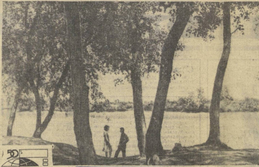
НА ФОТОКОНКУРС «ОКТЯБРЬ И МЫ» НУКУС. В Грачевой роце.