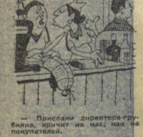
Прислали директора-руководителя, кричат на нас, как на покупателя.

Снариже, а до какого часа вы торгуете живой рыбой?