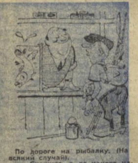
По дороге на рыбалку. (На восточном берегу).

Снариже, а до какого часа вы торгуете живой рыбой?