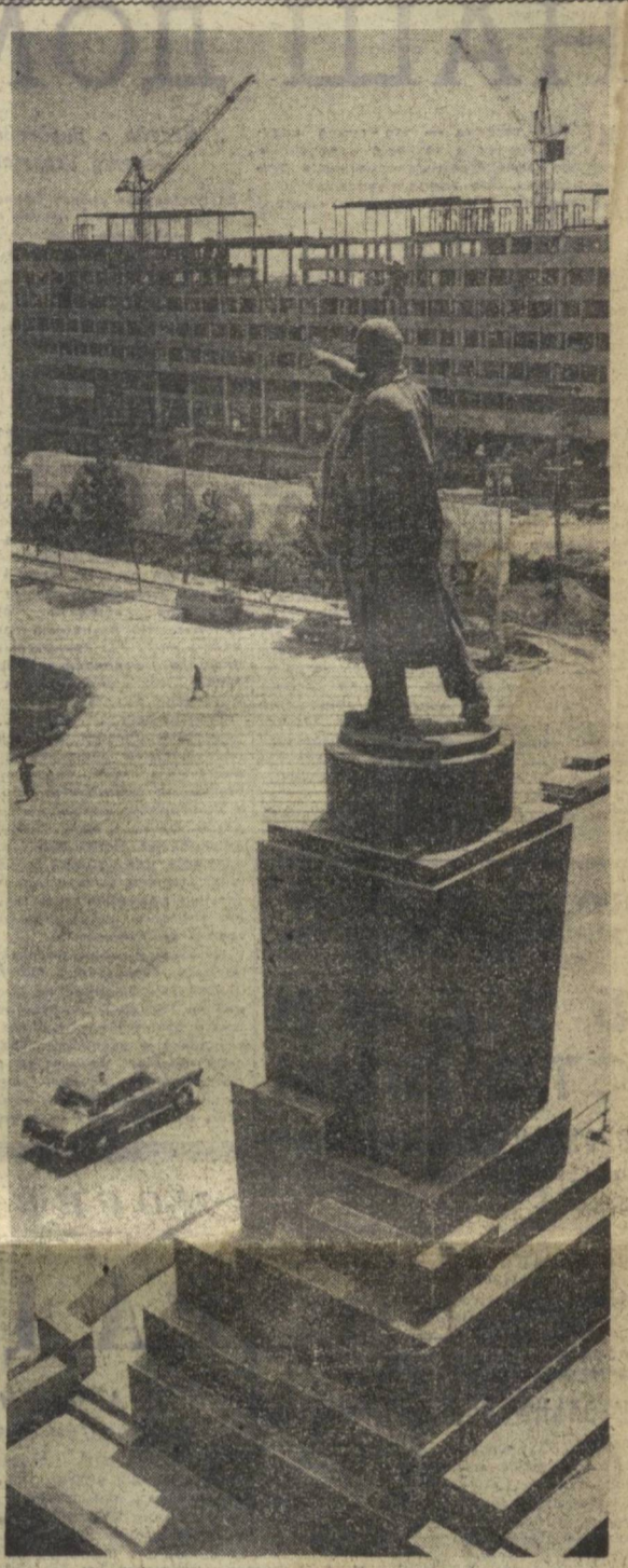
ТАШКЕНТ. Площадь В. И. Ленина.