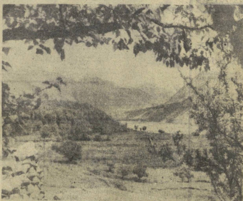
ПО РОДНОМУ КРАЮ

Мало свободных минут у Гроховского. И все же решил он сделать подарок великому 50-летию. Так появилась задумка о композиции на металле. Теперь она воплотилась в жизнь —