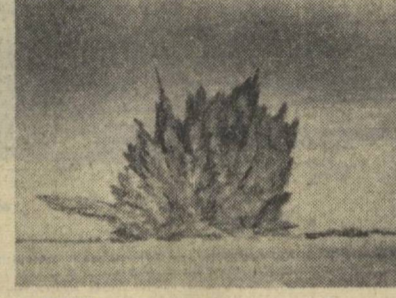
СОВСЕМ недавно мне пришлось побывать у Фархадских сил — там, где в военную пору в голой степи прогремел взрыв, показанный на данном снимке.

Сквозь Осию хорошо просматриваются здания ГЭС, небольшой, утопающий в зелени поселок энергетиков, трубы многочисленных заводов Фархада. Город окружен мощными лесными посадками, рощами, садами, виноградниками. Это венавадский лесхоз берет город в зеленое кольцо, сласая от свирепого ветра.