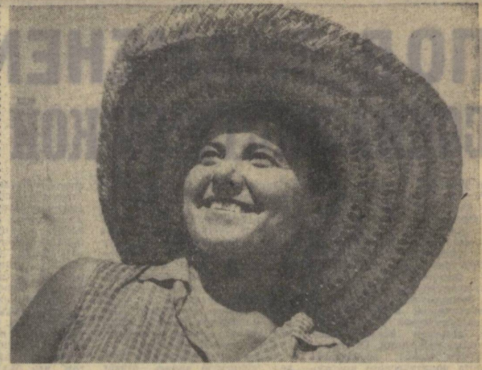
НАВСТРЕЧУ ДНЮ СТРОИТЕЛЯ

На страницах республиканских газет учреждаются Доски почета, на которые будут зачисляться области и районы, досрочно выполнившие план заготовок хлопка.