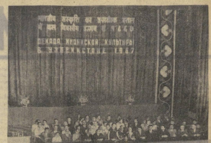
Открытие Декады индийской культуры в Узбекистане. На снимке: торжественное собрание в Большом Академическом театре оперы и балета имени А. Навои.

Достоинство встречает праздничные строители, участвующие в сооружении предприятий пищевой промышленности, больницы и поликлиники. Обширна география строящихся объектов. Не буду их перечислять. Только в хлопкоочистительной промышленности их насчитывается около сорока.