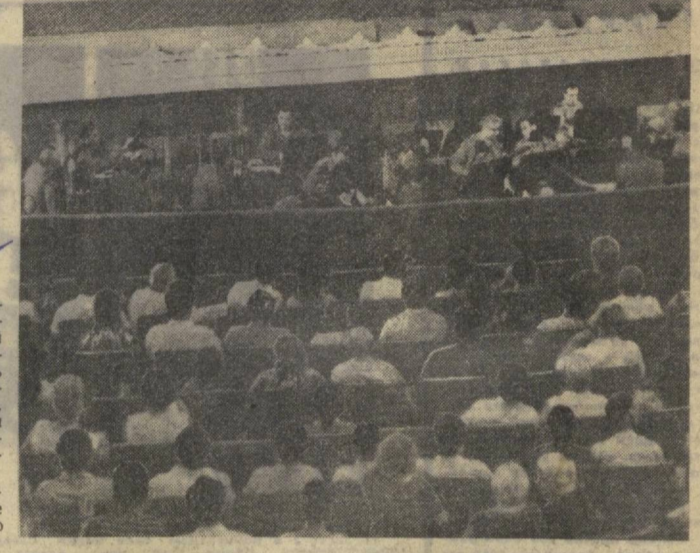
Открытие Декады индийской культуры в Узбекистане. На снимке: торжественное собрание в Большом Академическом театре оперы и балета имени А. Навои.

500-миллионный индийский народ с великим праздником — годовщиной независимости и пожелать народам Индии благополучия, процветания, мира и новых успехов в укреплении политической и экономической независимости страны.