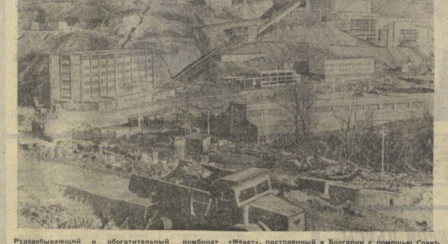
Рудодобывающий и обогащающий комбинат «Медет», построенный в Болгарии с помощью Советского Союза, — одно из самых крупных предприятий такого рода не только в республике, но и в Европе. Ежегодно, после полного завершения строительства, комбинат будет перерабатывать 8 миллионов тонн медной руды.

ДЕЛИ, 15 августа. (ТАСС). Вчера, накануне национального праздника — Дня независимости Индии, по радио выступил президент республики Закир Хусейн. Он призвал народ к единству и объединению усилий для выполнения программы развития Индии.