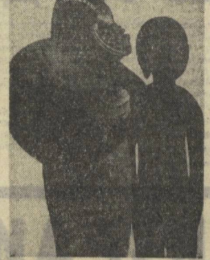
На снимке: «Женщина с ребенком».

Эти исторические даты во многом определили характер нынешних выставок произведений народного искусства, детского творчества, художественной фотографии, сувениров, которые открылись в эти дни в Ташкенте и в Дормане. Немногочисленные, но очень характерные экспонаты народного прикладного творчества,