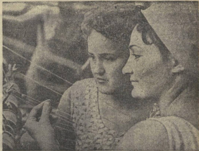
Коллектив текстильно-галантерейной Фирмы «Учкун» несет трудовую вахту в честь приближающегося славного 50-летнего юбилея Советского государства...

ГОД РЕВОЛЮЦИИ 50-й № 192 (15435) Четверг, 17 августа 1967 года Цена 2 коп.