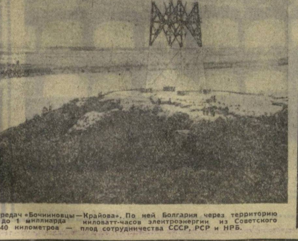
Вступила в строй линия электропередачи «Бочиноцы — Крайова». По ней Болгария через территорию Румынии будет получать ежегодно до 1 миллиарда кВт-часов электроэнергии из Советского Союза. Линия протяженностью 140 километров — плод сотрудничества СССР, РСР и НРБ.