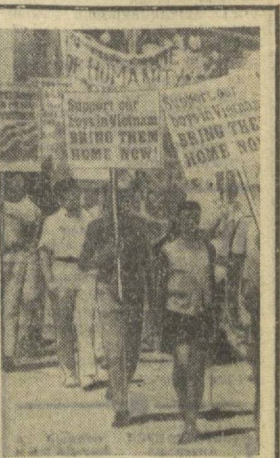
В городе Атланта (штат Джорджия, США) состоялась демонстрация с требованием немедленного вывода американских войск из Южного Вьетнама.

СОВМЕСТНОЕ ВОЙСКОВОЕ УЧЕНИЕ ДРУЖЕСТВЕННЫХ АРМИЙ БЕРЛИН, 19 августа. С 14 по 18 августа на территории округов Потсдам и Магдебург проводилось совместное войсковое учение соединений и частей Национальной народной армии ГДР и 1 группы советских войск в Германской Демократической Республике, сообщает агентство АДИ. В ходе учения были показаны высокая боеготовность и хорошее взаимодействие всех участвовавших сил. На учении присутствовали главнокомандующий объединенными вооруженными силами государства — участник Варшавского договора и первый заместитель министра обороны СССР Маршал Советского Союза И. И. Якубовский, министр национальной обороны ГДР генерал армии Г. Гофман, заместитель министра национальной обороны ПНР генерал-полковник Е. Бордковский, заместитель министра национальной обороны ЧССР генерал-лейтенант Ф. Шадек.