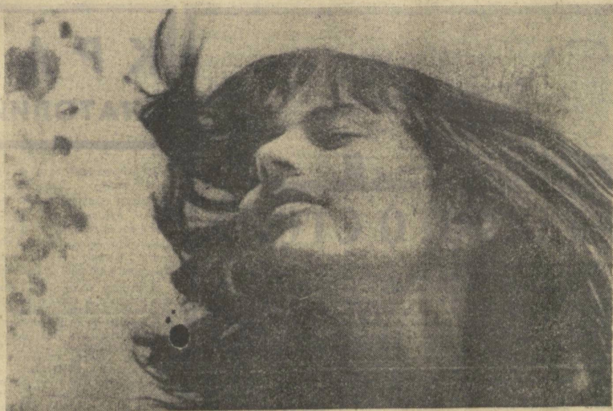
На фотоконкурс «Октябрь и мы» ЮНОСТЬ.