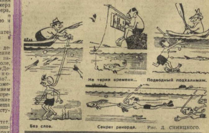
Без слов. Секрет репорта. Рис. Д. СИНИЦЫНА.