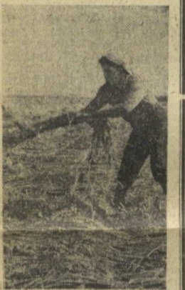
Хороший уход за посевами помидоров...