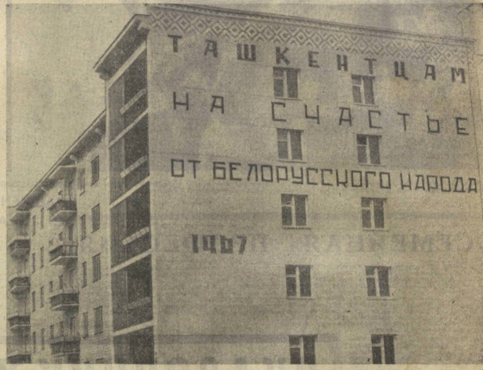
Ташкент строит вся страна. На снимке: подарок строителей Белоруссии столице Узбекистана.

сот тысяч километров кабелей и проводов, выпускаемых заводом ежедневно, находят широкий спрос. Изделия завода поставляются в Прибалтику и Закавказье, в Сибирь и на Дальний Восток, в Киргизию и Казахстан — во все уголки нашей необъятной Родины. В картотеке отдела сбыта насчитывается более 15 тысяч фондодержателей. У нашего завода обширные интернациональные связи. Широким потоком идет поставки на экспорт. Изделия с маркой «Ташкенткабель» поставляют Чехословакия, Польша, Румыния, Венгрия, Болгария, КНДР, Демократическая Республика Вьетнам, ОАР, Сирия, Ирак, Индия, Афганистан, Бирма и другие государства. Завод использует сырье и материалы более 250 наименований, имеет столько же поставщиков, взаимоотношения с которыми регулируются прямыми хозяйственными договорами. Многие годы ташкентских кабельщиков связывает тесная дружба с коллективами заводов «Тожкабель» и «Амуркабель». С этими предприятиями ежегодно заключаются договоры о социалистическом соревновании, производится обмен делегациями. Регулярно осуществляется проверка социалистических обязательств. Соревнующиеся предприятия систематически обмениваются производственно-технической информацией со всеми предприятиями кабельной промышленности страны.