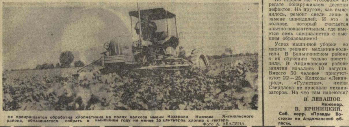
Не прекращается обработка хлопчатника на полях колхоза имени Назарали Ниязова...