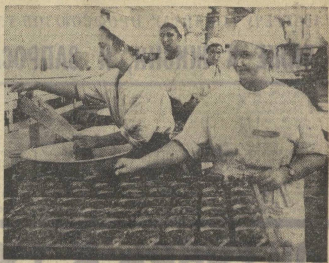
Войско идет переработка фруктов и овощей многого урожая на Ташкентском консервном заводе...

ГОД РЕВОЛЮЦИИ 50-й № 196 (15439) Вторник, 22 августа 1967 года Цена 2 коп.