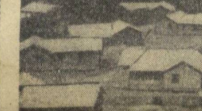
В живописном местечке долины Ангрена вырос пионерский лагерь, который вы видите на снимке. Здесь вы сможете отдохнуть.