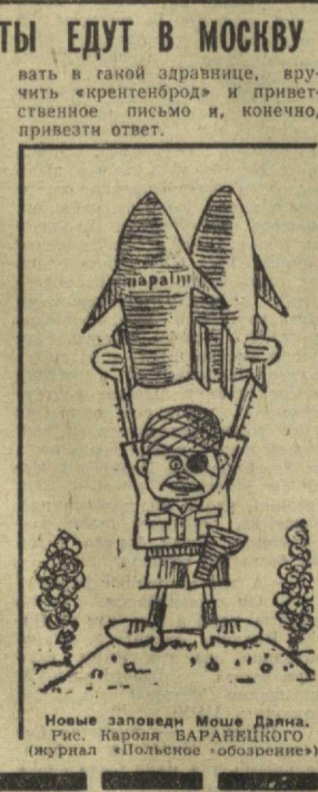
Новые заповеди Моше Даяна.