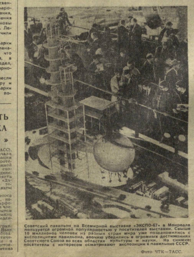
Советский павильон на Всемирной выставке «ЭКСПО-67» в Монреале пользуется огромной популярностью у посетителей выставки. Самые разнообразные посетители с интересом рассматривают экспозицию в павильоне СССР.