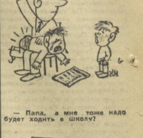
— Папа, а мне тоже надо будет ходить в школу?