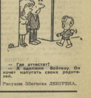
— Где аттестат? Я одолжил Войтенку. Он хочет напугать своих родителей. Рисунки Зигмунда ЛЕНГРЕНА.