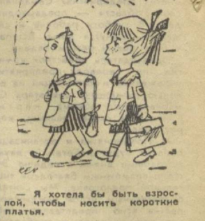
— Я хотела бы быть взрослой, чтобы носить короткие платья.