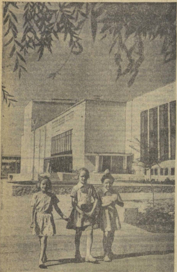
Хороший подарок от строителей Чирчика получили жители города комбината жаропрочных и тугоплавких металлов. Здесь завершено строительство Дворца культуры металлургов в здании — зрительный и спортивный залы, множество комнат для кружковой работы, просторное фойе. На этом снимке вы видите фасадную часть дворца.