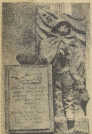
Этот патинки героини колхоза имени К. Маркса Нарпайского района павшим на фронтах Великой Отечественной войны, создан по эскизам школьницы города Навои и отлит на одном из его заводов. Недавно состоялось торжественное открытие памятника.

В ИНТЕРЕСЕ , который вызвала открывшаяся 6 сентября юбилейная выставка изобразительного искусства Узбекистана, говорит такой факт: за два часа после открытия ее посетили свыше пяти тысяч человек. Выставка разделена как бы на три периода, рассказывающие об основных этапах пройденного республикой пути за 50 лет. Это годы революции и гражданской войны, период Великой Отечественной войны, период Великой Отечественной войны, период Великой Отечественной войны, период Великой Отечественной войны.