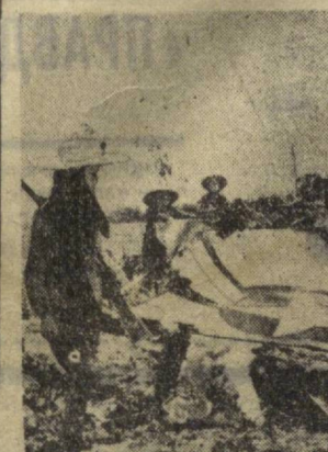
демократическая Республика Вьетнам. Обломки одного из американских самолетов, сбитых зенитниками Ханоя.

В речах ораторов, выступавших на реваншистских митингах, содержались нападки на президента Франца де Голля за то, что он, находясь с официальным визитом в Польской Народной Республике, выступил за признание границы по Одеру — Нейсе.