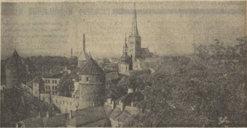
Столица Эстонской ССР — город Таллин. Вид на старый город.

Или возьмем машиностроение. В Эстонии эта отрасль промышленности имеет давние традиции. За прошедшее семилетие машиностроение республики получило дальнейшее развитие — возросло почти в 3,5 раза. Мы производим много новых машин, приборов и оборудования, которые ранее в Эстонии не выпускались, такие, как экскаваторы, грейдеры, автопогрузчики, ртутные и полупроводниковые выпрямители, трансформаторы, высоковольт-