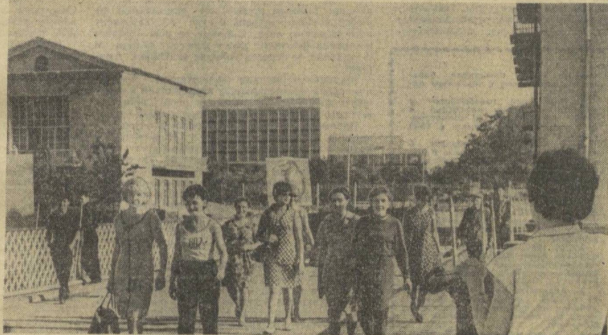
Ташкент сегодня. Вид со стадиона «Пахтанор».

У ВАС в газете была статья в «Защиту капризных» — о бездушных руководителях, которые не заботятся о рабочих. Мне хочется сказать, что это удивительно. Вот я — рядовая служащая в кокандской швейной фирме имени Ахунбаева. Часто болею, перенесла шесть операций. И как же ко мне душевно относятся в коллективе! Все время оказывают материальную помощь, давали путевки в санатории. Когда заболела — приходили всегда в больницу представители фабкома, партийной организации и просто товарищи по работе.