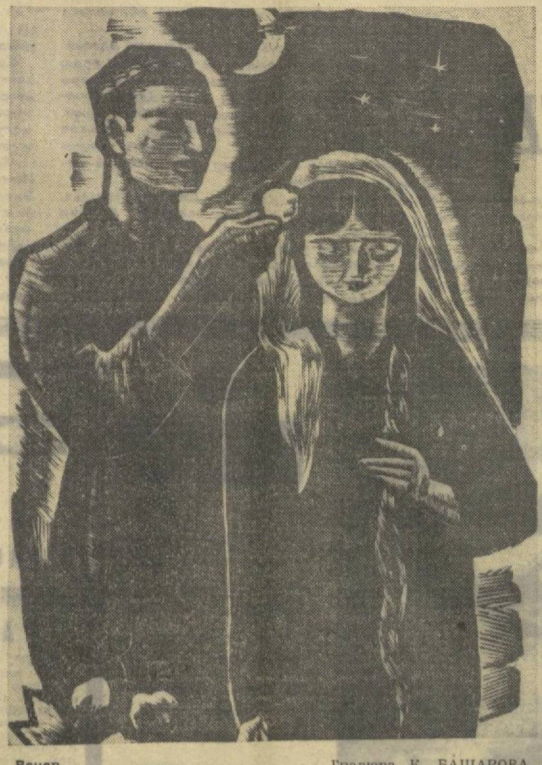
Гравюра К. БАШАРОВА.

В. РЕШЕТНИКОВ. Начальник Ташкентского почтамта.