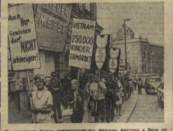
По инициативе Союза демократических женщин Австрии в Вене состоялась демонстрация протеста против американской агрессии во Вьетнаме. Участники манифестации призвали покончить с войной во Вьетнаме, активно бороться за мир.

Н. СУЧКОВ. Международный обозреватель «Правды Востока».