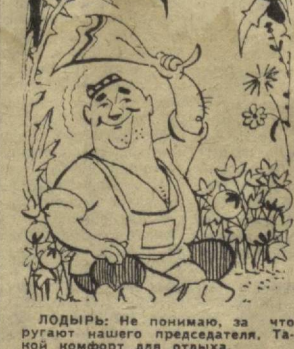
ПОДЫРЬ: Не понимаю, за что ругают нашего председателя. Такой комфорт для отдыха.