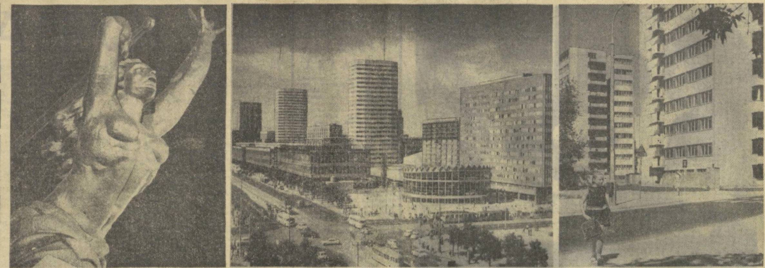
Памятник героям Варшавского восстания на Театральной площади. Новый жилой и торговый центр Варшавы. Жилые дома в районе Монкотов.