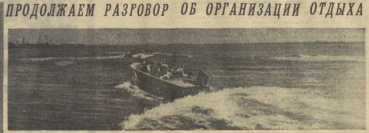
Все лето Ташкентское море бороздили прогулочные катера...