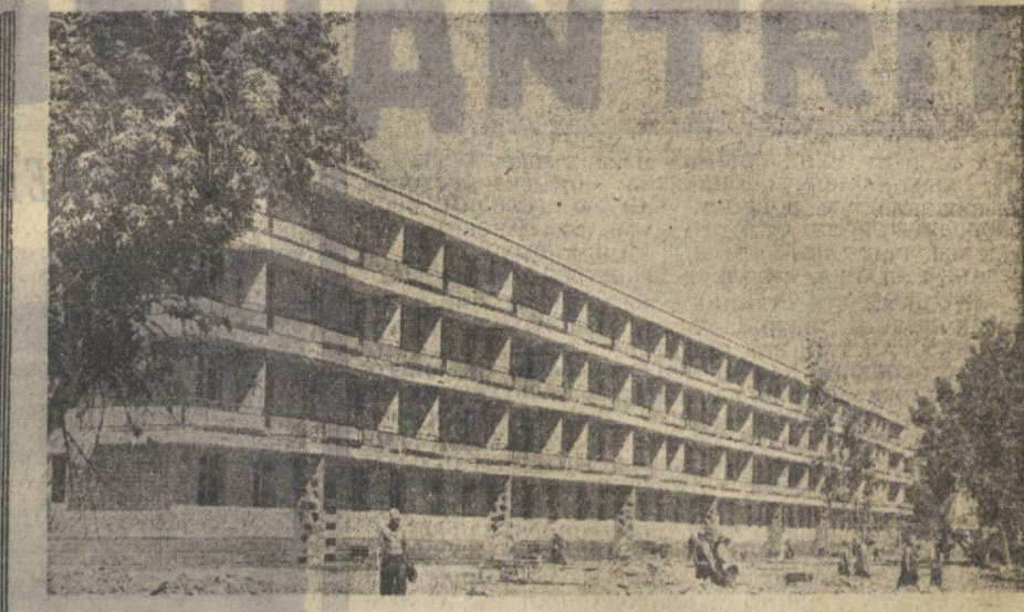
Первые шесть жилых домов возведены в центре города — квартал ЦД. Это — новые дома в микрорайоне «Урицкого».

И. МУРАКОВ. Начальник лаборатории завода «Красный двигатель» имени В. И. Ленина. г. Самарканд.