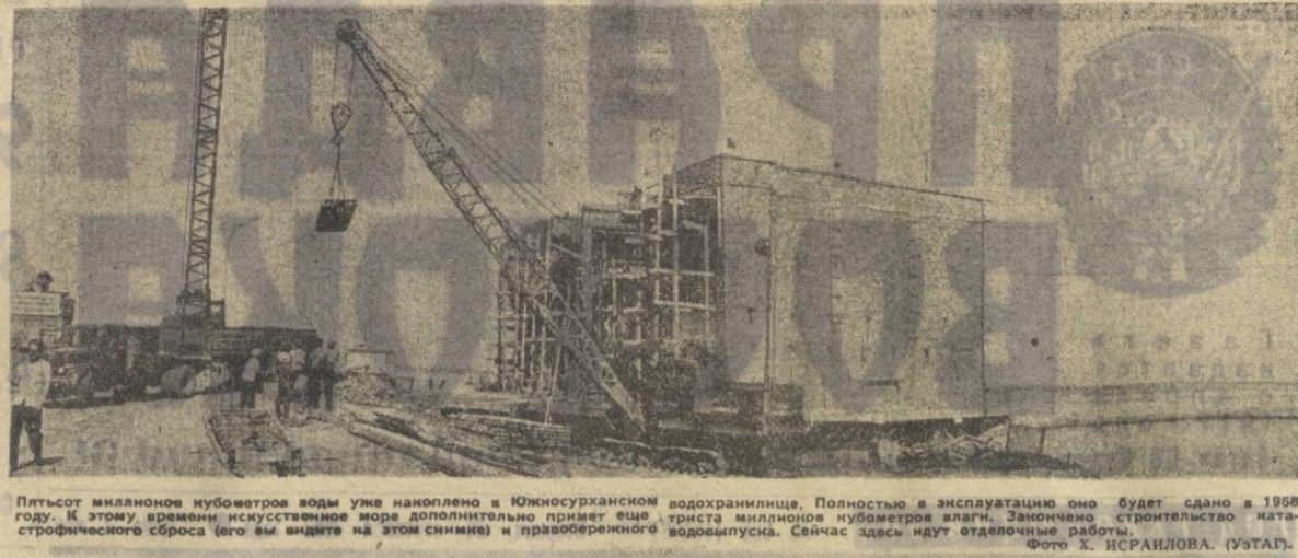
Пятьсот миллионов кубометров воды уже накоплено в Южносурханском водохранилище. Полностью в эксплуатацию оно будет сдано в 1968 году...