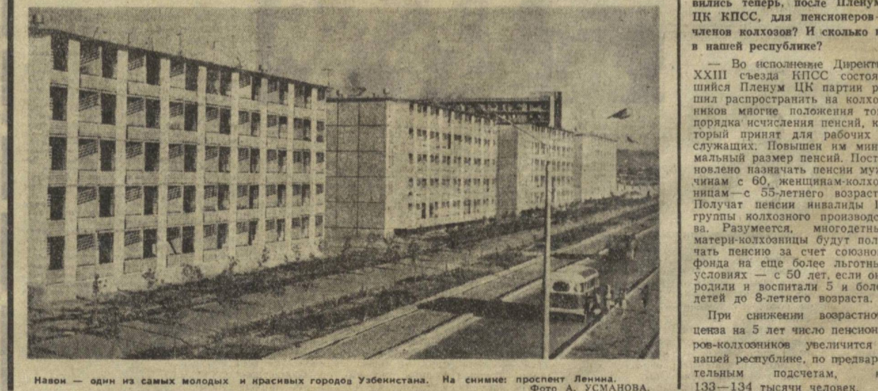
Навои — один из самых молодых и красивых городов Узбекистана. На снимке: проспект Ленина.

печенья колхозников? Местным органам собесов? — Хотелось бы предостеречь вновь избранных членов советов от некоторых «типичных» ошибок. Ложка дегтя портит бочку меда, говорят в народе. К сожалению, серьезные нарушения закона были из-за отсутствия бдительности, из-за либерального отношения к нарушителям и даже злоупотреблениям. В результате отдельные лица сумели получить пенсию не имея на это прав. Не принимавшие участия в колхозном производстве женщины, при содействии отдела их должностных лиц из правлений колхозов, получали по безмерности и родам — от 200 до 800 рублей. — Те, кто допустил такое, наказаны, — продолжает министр, — но хочется, чтобы