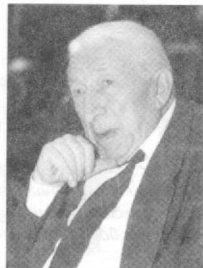
Расул ҲАМЗАТОВ (1923-2003)