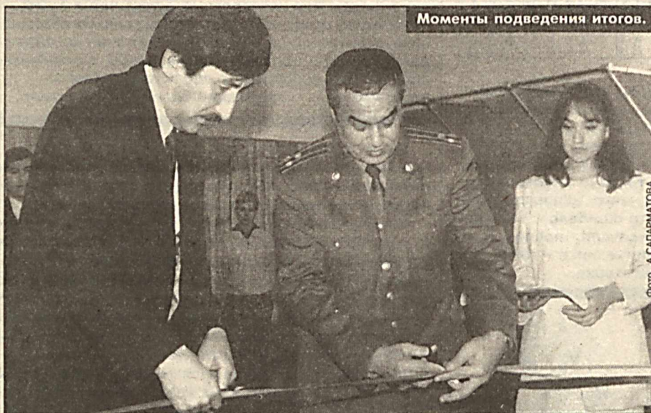
Моменты подведения итогов.

Прошедший 1999 год был отмечен яркими спортивными победами узбекистанских спортсменов в крупнейших международных соревнованиях, но этих успехов нельзя было бы добиться без широкого развития массового и детского спорта, без повсеместного внедрения в жизнь наших людей основ физической культуры.