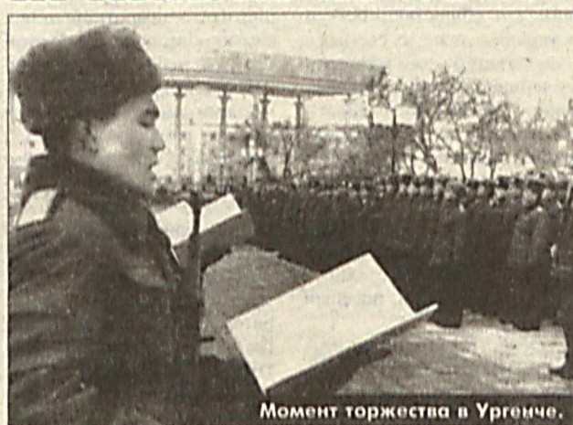
Момент торжества в Ургенче.

Торжественное принятие присяги молодыми сотрудниками органов внутренних дел состоялось в Ургенче. Церемония проводилась у мемориала Жалолиддина Мангуберды, что в центре города.