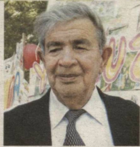
Xudoyberdi TO'XTABOYEV, O'zbekiston xalq yozuvchisi

Yurtimizda farzandlarimiz kamoloti uchun yaratilayotgan barcha sharoitlar, ular qarshisidagi imkoniyatlar uchun Prezidentimizdan behad minnatdorman. Bolalar dunyosida uzoq yillardan buyon faoliyat yuritayotgan inson sifatida bu e'tibor barchani birdek quvontiriyapti, xalqimizning ertangi kunga, kelajakka bo'lgan ishonchini mustahkamlayapti, deb baralla ayta olaman.