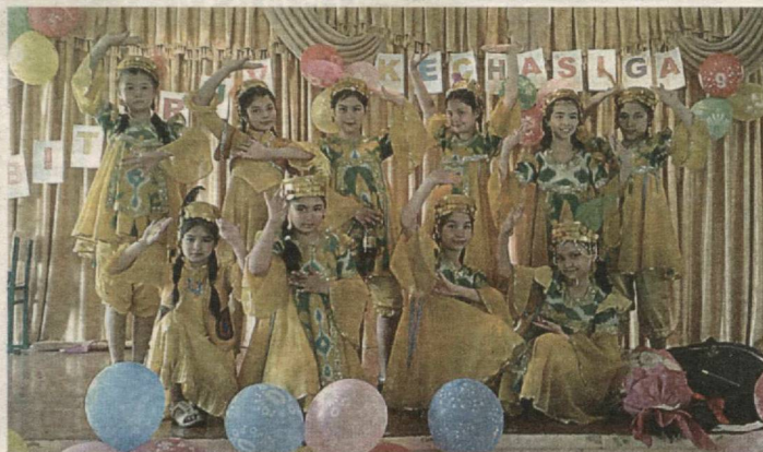
Poytaxtimizning Yunusobod tumanidagi 259-umumta'lim maktabining 4-«A» sinf o'quvchilari bilan «Xayr boshlang'ich ta'lim» deb nomlangan tadbir bo'lib o'tdi.

Mening shirindan shakar kichkin-toylarim! Bugun sizlarning – qalbi beg'ubor bolajonlarning bayrami. Aslida, faqat birinchi iyun emas, har bir o'tayotgan kuningiz bayramdir. Har biringizning orzularingiz osmon qadar. Ishonamanki, siz ularga, albatta, erishasiz! Chunki yurtimizda nimaiki qilinayotgan ishlar bo'lsa, barchasi sizning porloq kelajagingiz uchun. Har doim shunday yuksak marralar tomon qadam tashlang.