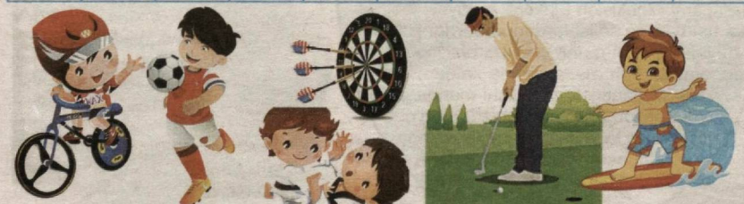
Baseball, Judo, Football, Basketball, Cycling, Boxing, Lawn Tennis, Surfing, Dartboard, Golf.